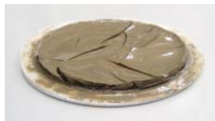
After tests. После испытаний.