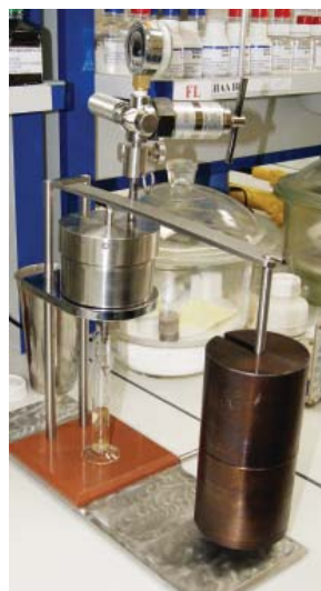
● Fig. 2. Device for sticking risk determination.