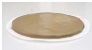
Prior to tests. До испытаний.